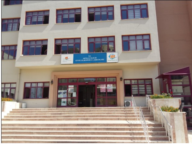
Antalya Çevre ve Şehircilik İl Müdürlüğü semineri / 21 Mayıs 2015