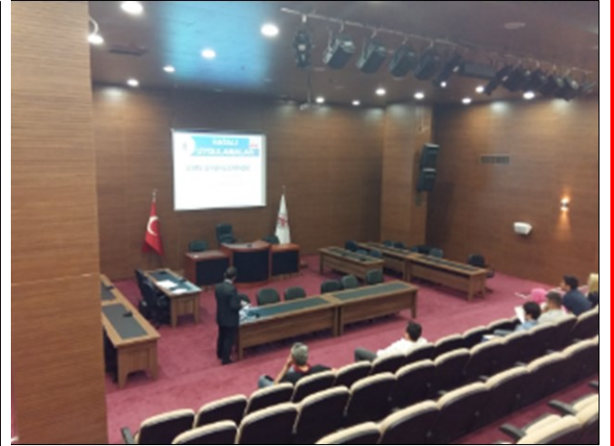
Antalya Döşemealtı Belediyesi semineri / 22 Mayıs 2015