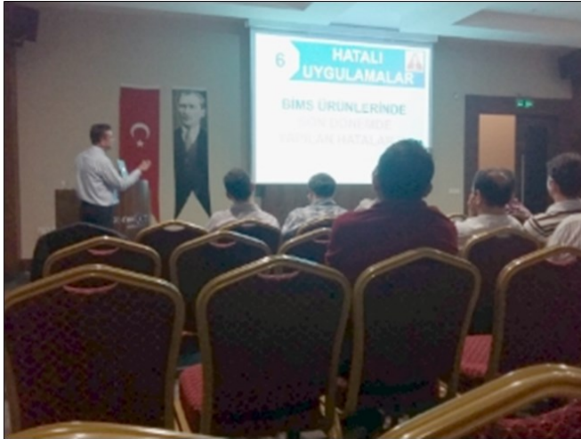
Antalya Konyaaltı Belediyesi semineri / 22 Mayıs 2015