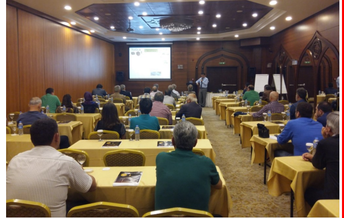
Antalya Yapı Denetim firmaları semineri / 29 Mayıs 2015

Bölgelerin desteği ile TUKDER tarafından organize edilen bölgesel teknik pazarlama faaliyetleri hızla sürmektedir. Afyon ve Burdur sanayicilerinin desteği ile Akdeniz bölgesindeki faaliyetler, hız kesmeden