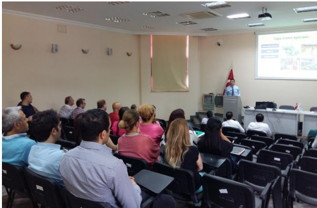
Antalya Çevre ve Şehircilik İl Müdürlüğü semineri / 29 Mayıs 2015