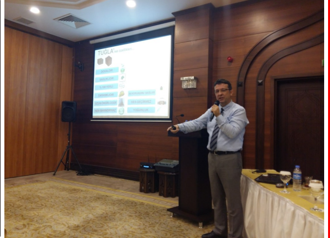
Antalya Muratpaşa Belediyesi semineri / 21 Mayıs 2015